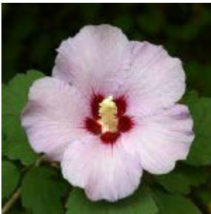
La Rosa de Sarón símbolo de pureza y belleza