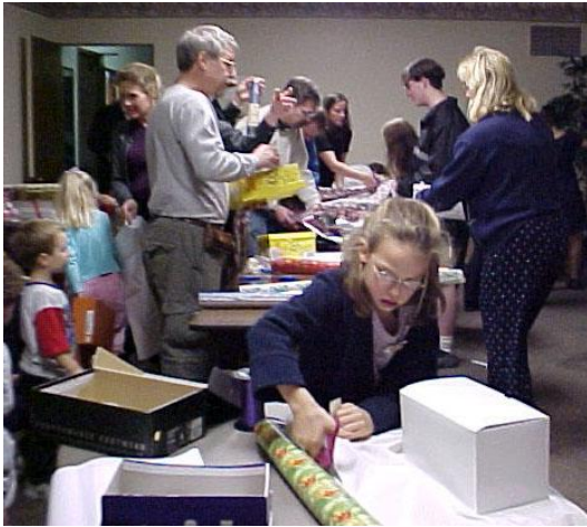
Envuelto regalos en un asilo.