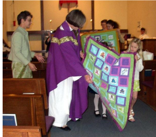
Haciendo colchas para niños necesitados.